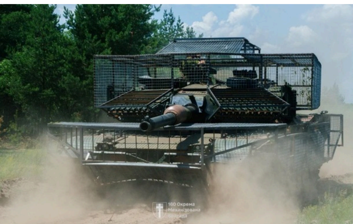
Фото: 160 ОМБр ЗСУ ведуть важкі бої на сході і півдні України

Найбільш активно російські окупанти діють на Покровському напрямку. Там підрозділи ЗСУ вже відбили понад 20 атак.