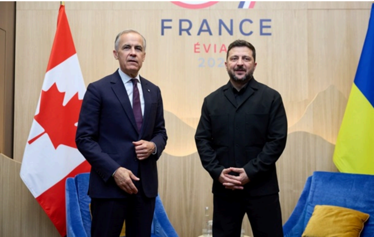
Зеленський зустрівся з прем'єр-міністром Канади

Зеленський з прем'єр-міністром Канади Марком Карні обговорили посилення санкцій проти Росії та оборонну підтримку України.