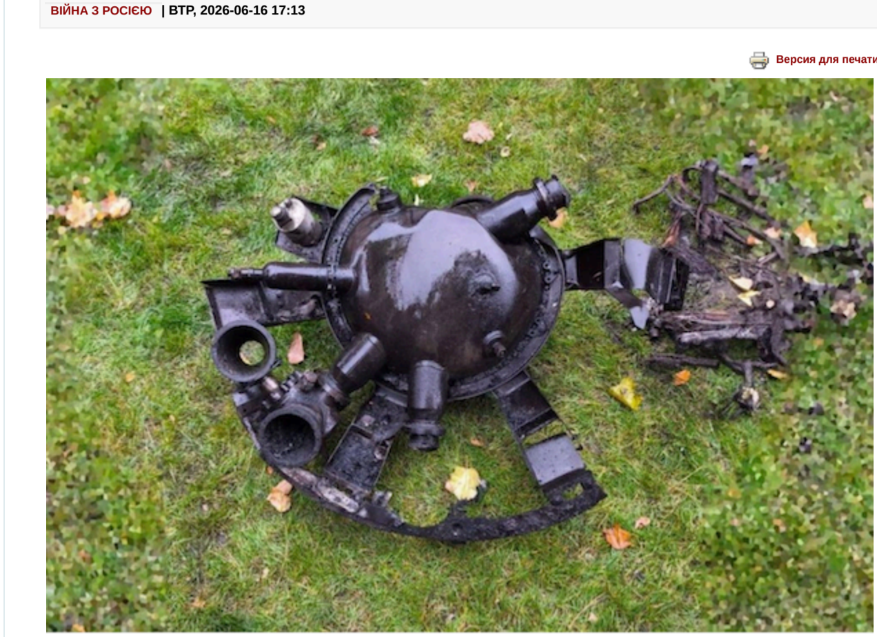
Російська БРСД «Орешнік» страждає від непереробного дефекту системи наведення, через який відхиляється від мети на десятки кілометрів.

Це випливає з внутрішнього листування російських оборонних підприємств, яке опублікувала аналітична компанія Dallas Analytics .