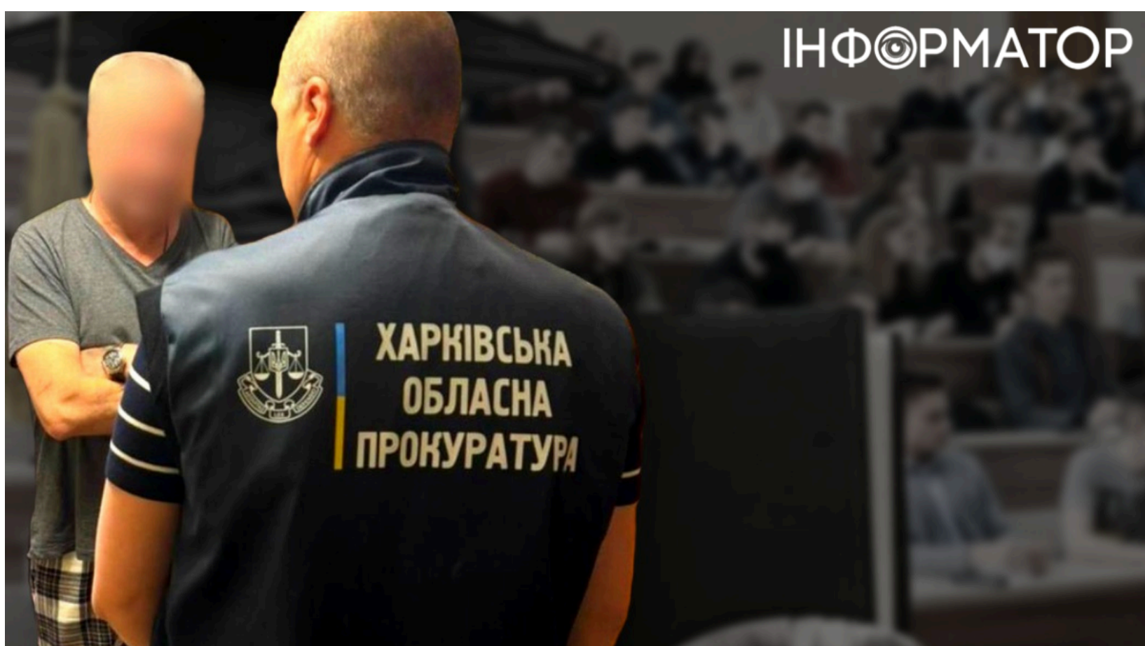
Фіктивні заклади освіти для бронювання у Харкові

У Харкові розкрили одразу дві схеми незаконного отримання відстрочки від мобілізації через фіктивні заклади освіти. Раніше Міністерство освіти і науки вже фіксувало подібні випадки - коли університети намагалися задніми числами зареєструвати тисячі "аспірантів" для легалізації ухилення від призову. Тепер шахраї пішли ще далі - вони просто вигадали заклади, яких не існувало взагалі: без ліцензій, без студентів, без будівель.