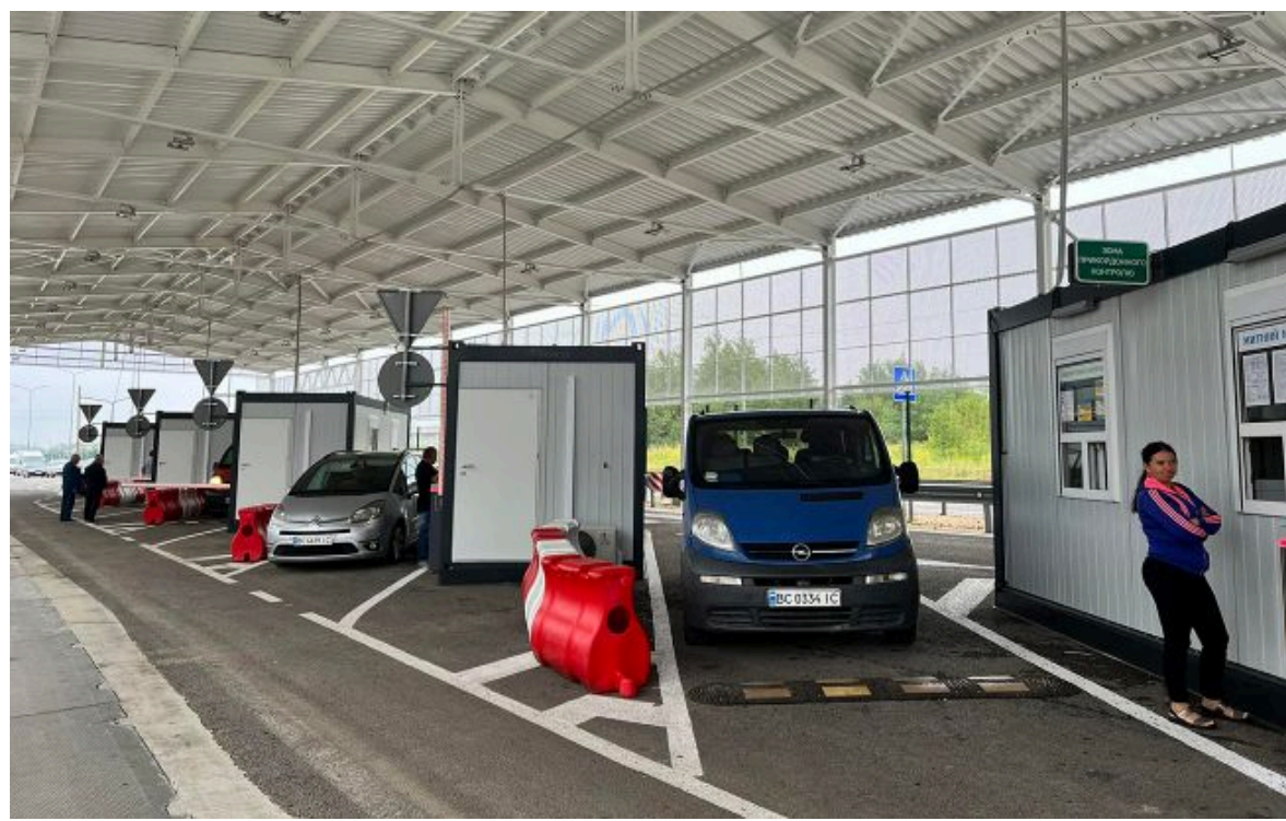
Фото: Вїїзд за кордон (facebook.com/zahidnyukordon)