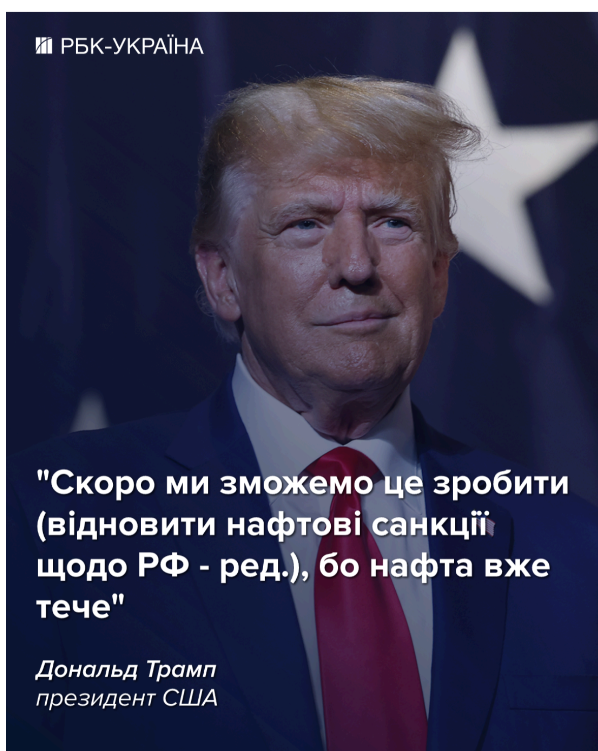
Фото: Трамп допустив поновлення санкцій проти РФ

Але, коли саме США скасують послаблення антиросійських санкцій, президент не уточнив.