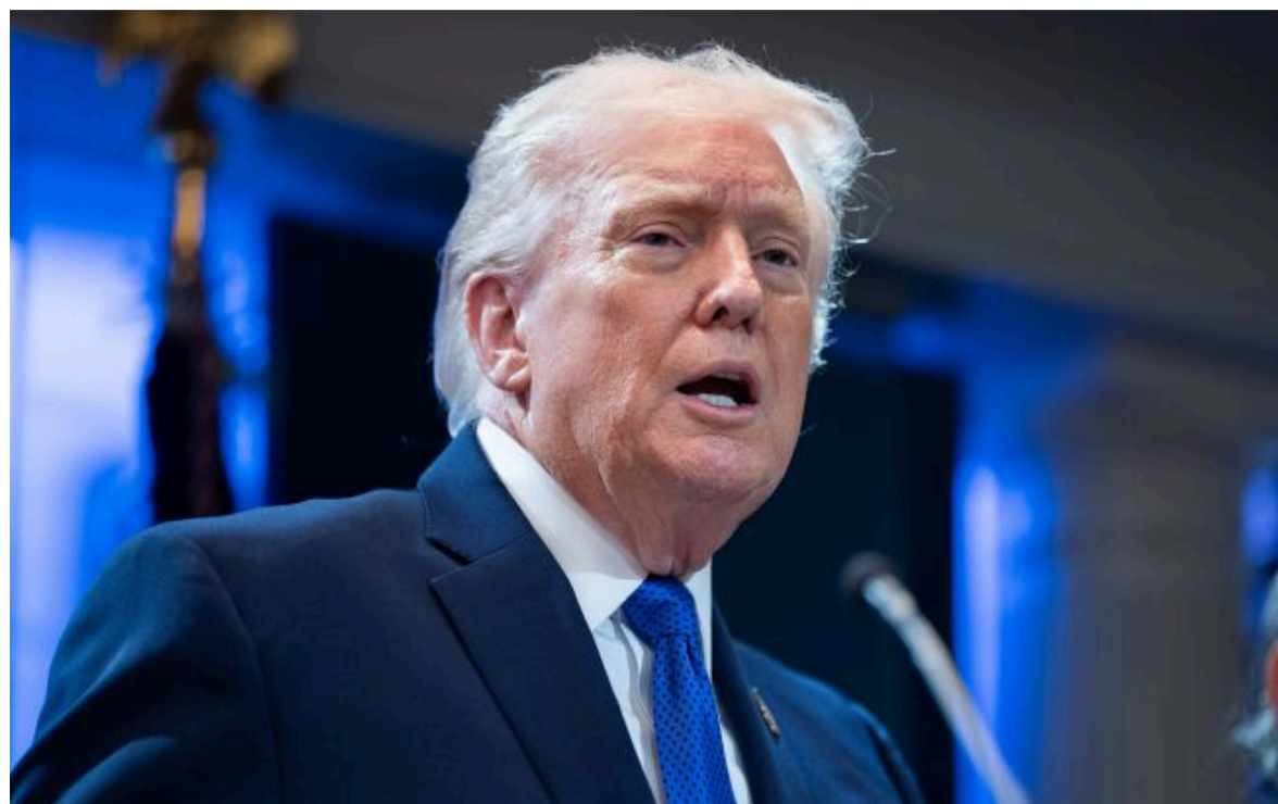
Фото: Дональд Трамп, президент США