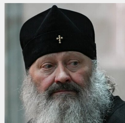
Екснамісник Лаври Павло назвав руйнування святині справою ..