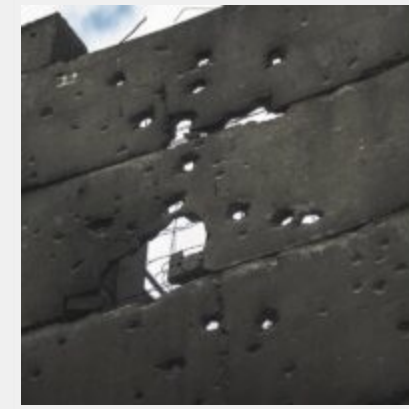
Як виглядає українська ТЕЦ, що пережила не одну ракетну атаку російських загарбників