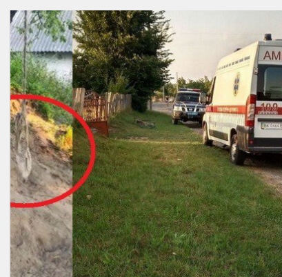
На Рівненщині 9-річний хлопчик покінчив життя самогубством: ..