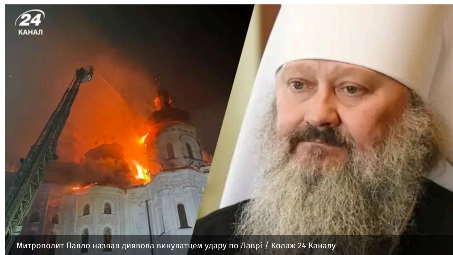
Митрополит Павло назвав диявола винуватцем удару по Лаврі

Масований російський обстріл 15 червня зачепив і територію Києво-Печерської лаври. Там спалахнула пожежа й сталися руйнування.