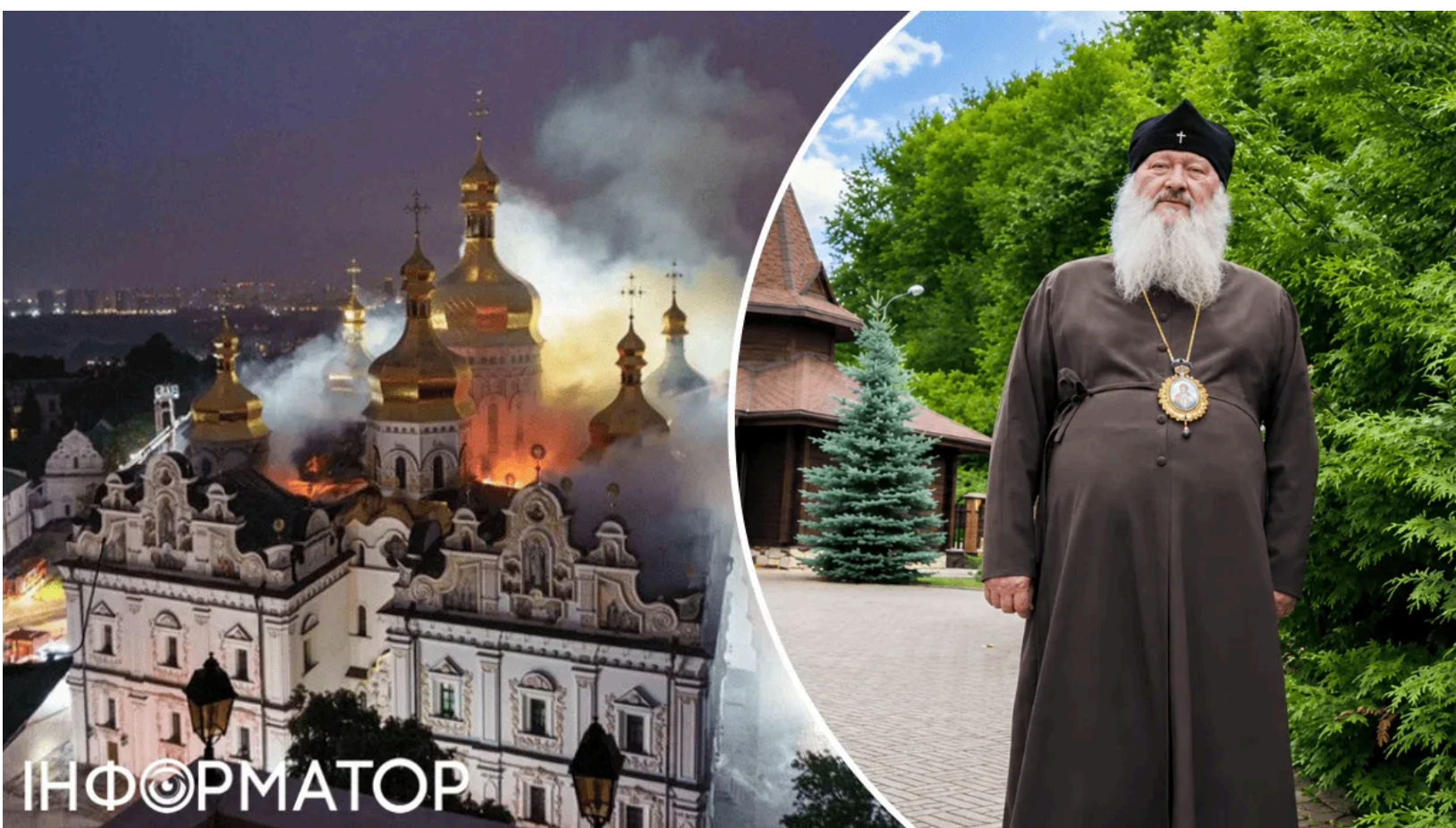
Митрополит УПЦ МП Павло звинуватив диявола у руйнуванні Лаври

Митрополит Української православної церкви Московського патріархату Павло (Лебідь) записав відеозвернення після того, як Росія завдала удару по Успенському соборі Києво-Печерської лаври. В УПЦ МП відреагували на удар по Успенському соборі , назвавши його трагедією для всього народу. Павло у своєму зверненні не назвав Росію відповідальною за атаку, проте зазначив, що православні у Росії "співчують".