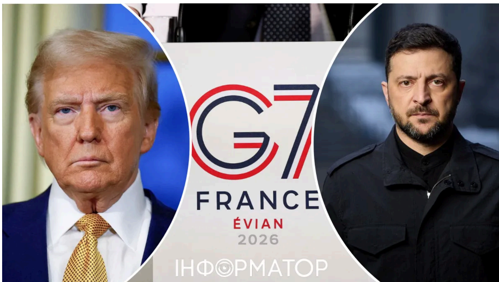
Зеленський зробив заяви після зустрічі з Трампом на G7

Президент Володимир Зеленський виступив із низкою важливих заяв на полях саміту "Групи семи" у французькому Евіані. Трампу, Зеленський і Макрон зустрілися на саміті G7 16 червня - вперше за майже чотири місяці. Головними темами стали антибалістичне озброєння, відновлення Києво-Печерської лаври та Чорнобиля, а також подальший тиск на Росію.