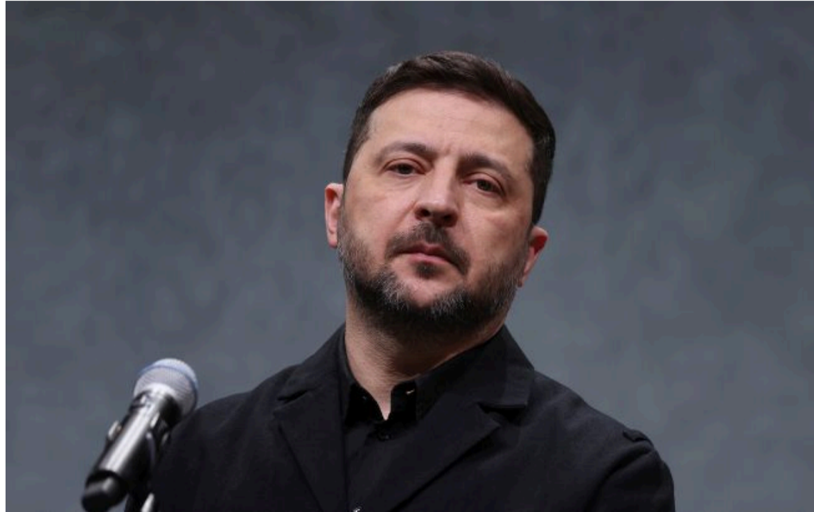
Фото: Володимир Зеленський (Getty Images)