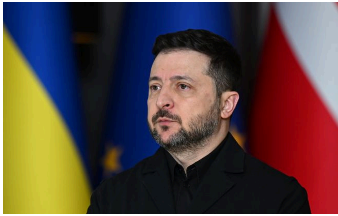
Фото: президент України Володимир Зеленський (Getty Images)