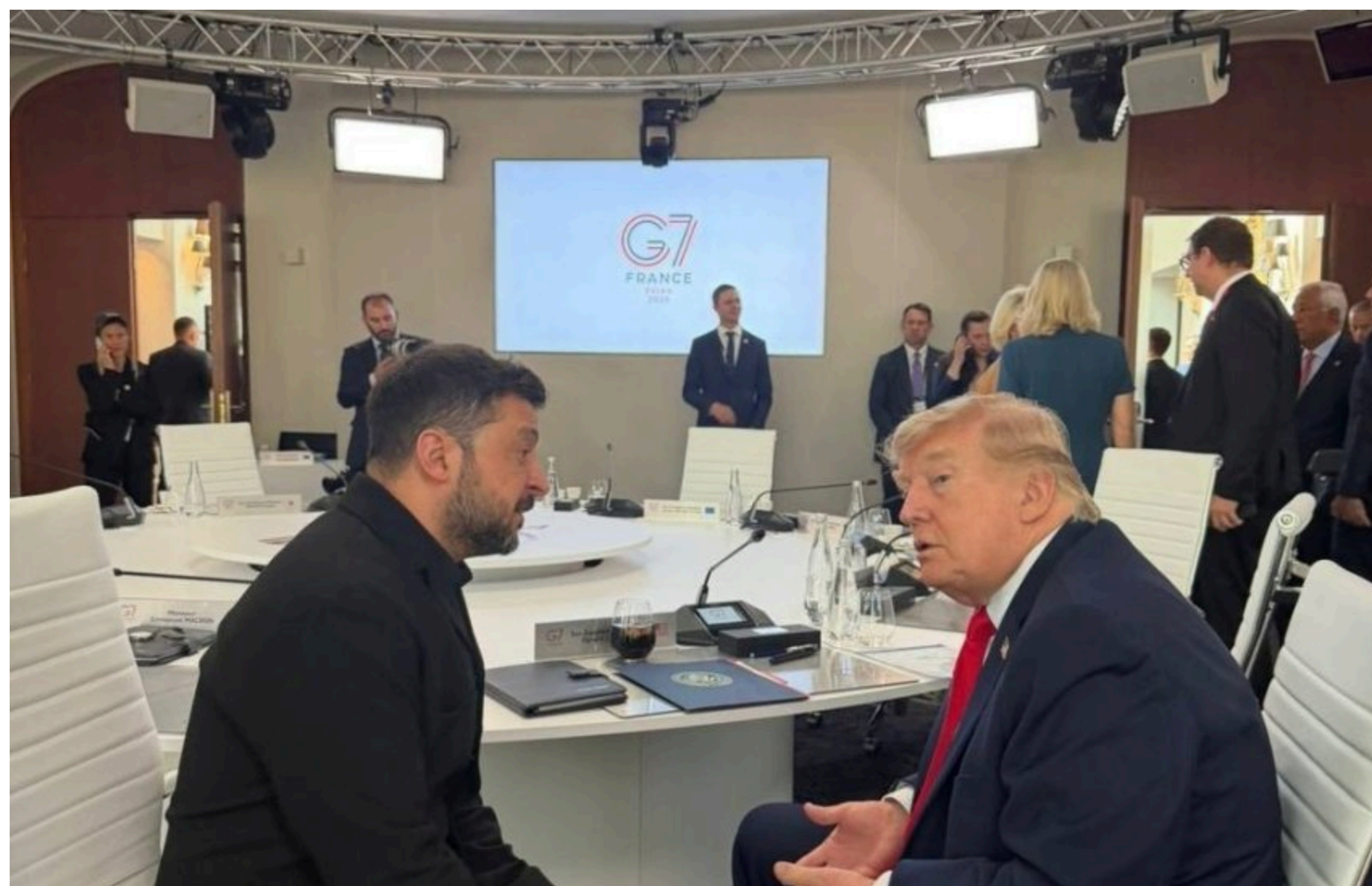
Зеленський та Трамп

Президент України Володимир Зеленський заявив, що під час зустрічі з президентом США Дональдом Трампом обговорював можливість отримання Україною ліцензій на виробництво протибалістичних ракет і систем протиповітряної оборони. Питання посилення ППО та енергетичної підтримки також стало однією з ключових тем переговорів під час саміту G7 у Франції.