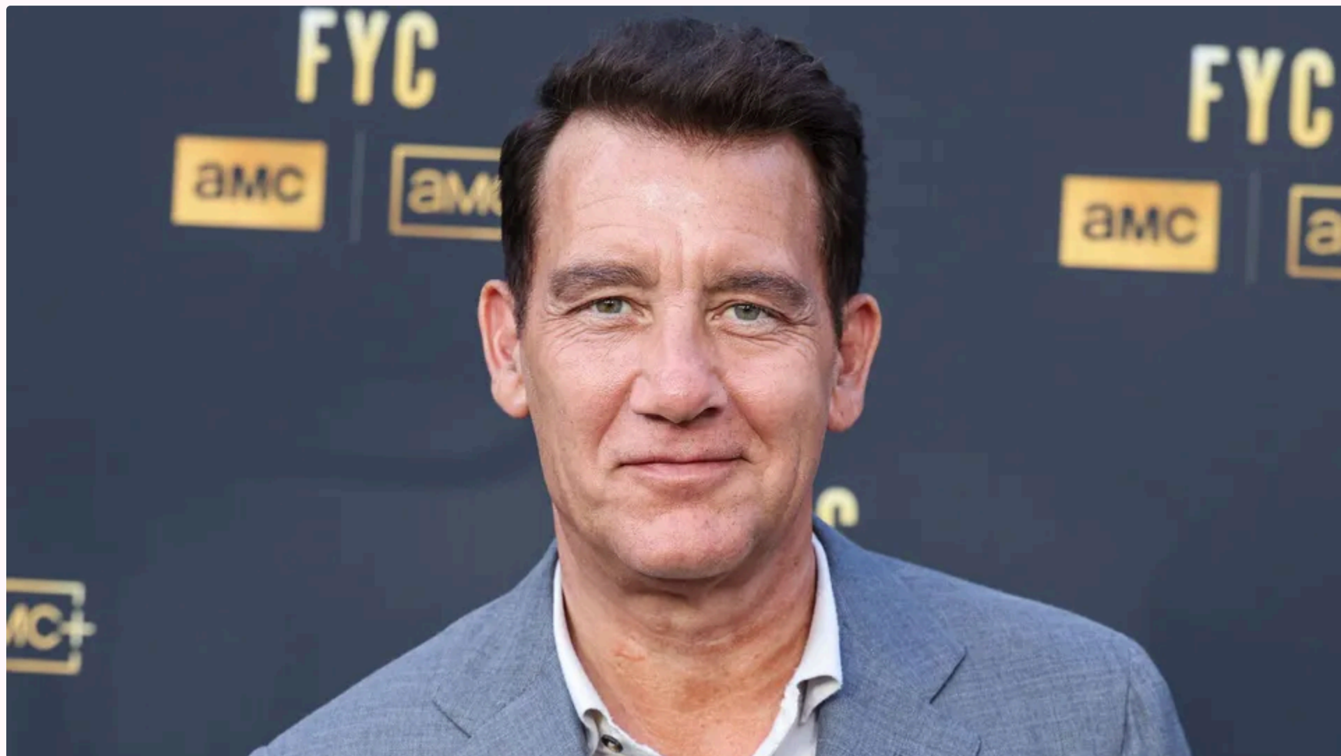
Оуен зізнався, що майбутня співпраця із українським режисером викликала в нього захват

Британський актор, лауреат премій BAFTA та "Золотий глобус" Клайв Оуен буде зніматися у фільмі українського режисера Мирослава Слабошпицького "Радіоактивні" (Radioactive). Про це повідомили видання Deadline і Variety із посиланням на заяву Оуена.