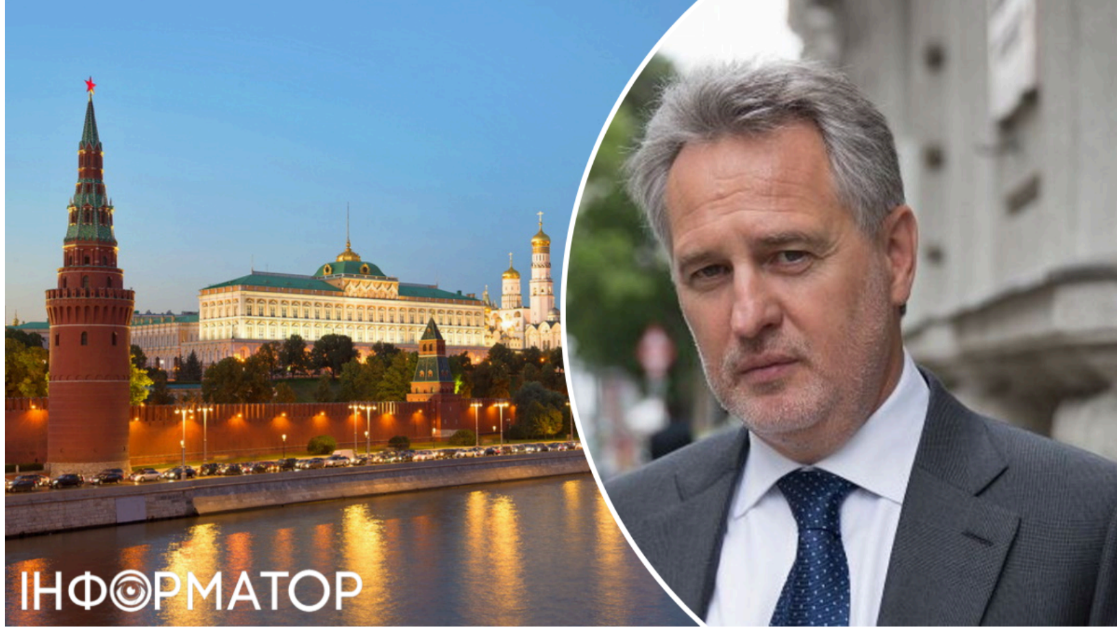
Хімічний анклав Москви

Український аграрний сектор традиційно називають локомотивом вітчизняної економіки. Проте мало хто замислюється про те, що цей локомотив уже багато років заправляє паливом людина, яка міцно пов'язана з країною-агресором. Дмитро Фірташ та його хімічна імперія «OSTCHEM Holding», що входить до складу фінансово-промислової групи «Group DF», фактично монополізували ринок мінеральних добрив в Україні. Контролюючи постачання аміаку та інших хімічних компонентів через такі гіганти, як ПрАТ «Укראгро НПК», ПАТ «Азот» (м. Черкаси), ПАТ «Рівнеазот» та ПрАТ «Сверодонецьке об'єднання Азот», олігарх утримує в заручниках усе сільське господарство країни. Але найстрашніше криється в деталях: нитки від цього хімічного зашморгу тягнуться безпосередньо до Москви, а прикривають цей бізнес «кишенькові» служителі Феміди в українських судах.