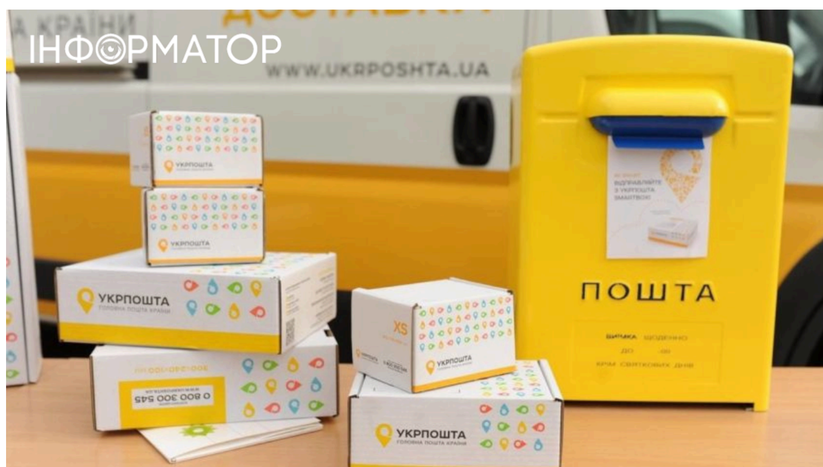
Укрпошта та Helsi - ліки з доставкою

Укрпошта спростила отримання ліків для пацієнтів по всій країні - тепер достатньо одного кроку замість двох. Мобільний застосунок Укрпошти вже давно дозволяє оформлювати відправлення онлайн, а тепер компанія пішла далі - у партнерстві з медичною платформою Helsi. Після підписання угоди між двома сервісами лікар може безпосередньо під час прийому спрямувати пацієнта до "Укрпошта Аптека". Безкоштовна доставка ліків стає доступною навіть у селах, прифронтових районах і там, де аптек немає взагалі.