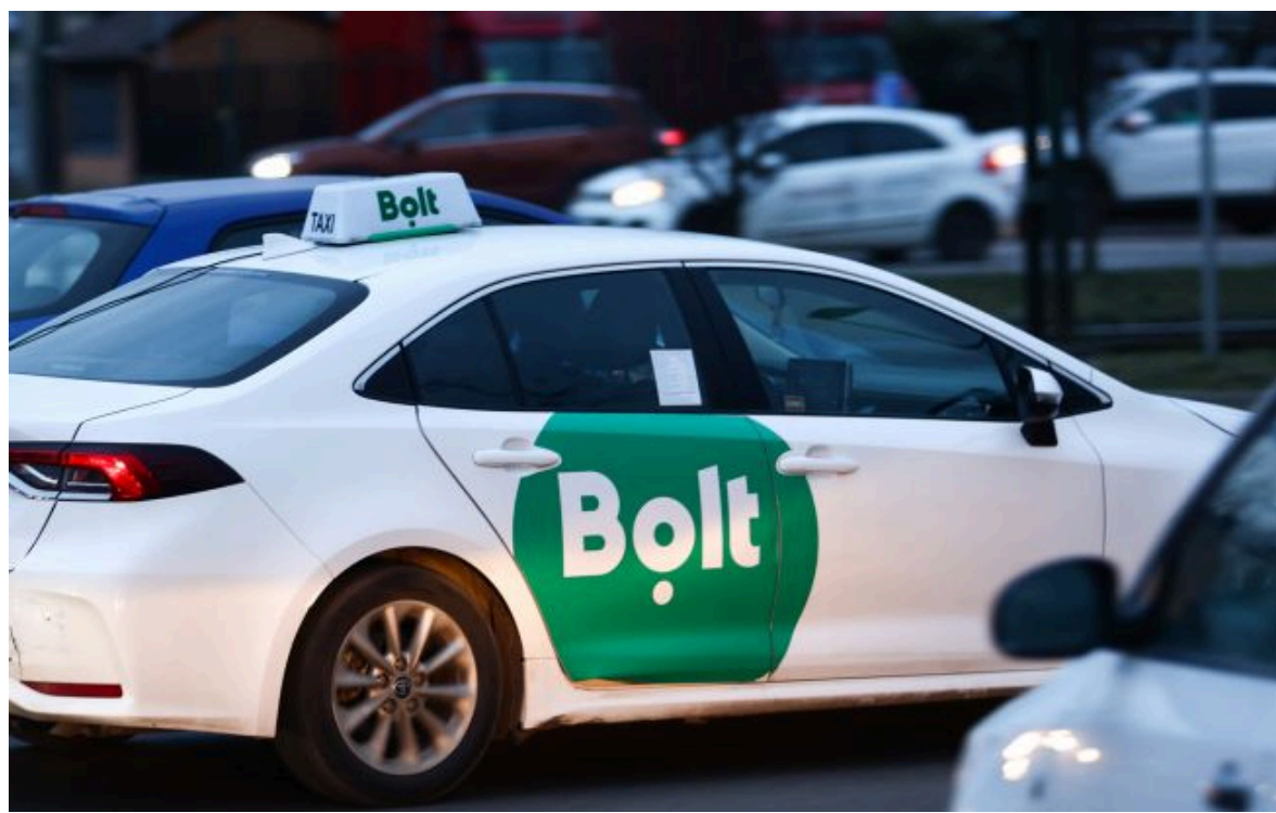
Фото: у компанії пояснили механізм формування цін під час тривоги та блекаутів