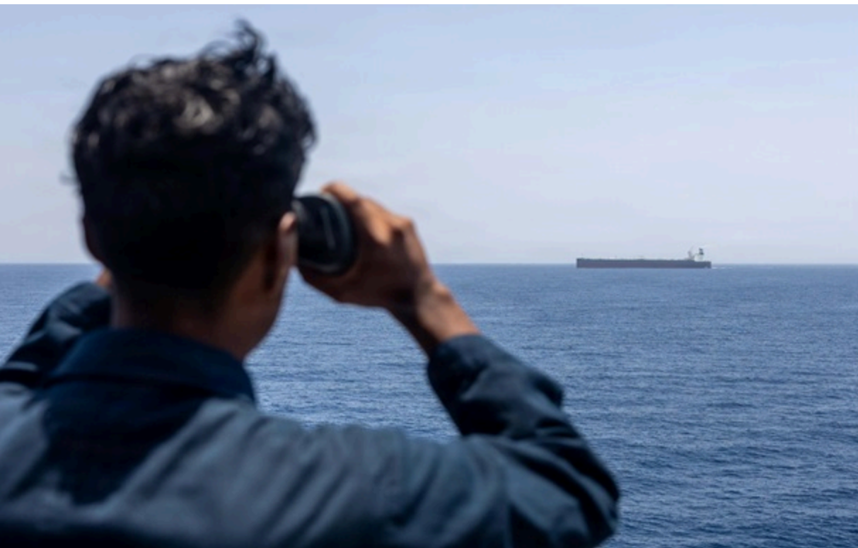
Матрос ВМС США на борту есмінця USS Rafael Peralta спостерігає за комерційним судном

Лінію американського контролю вже перетнули три нафтові танкери і два кораблі з товарами першої необхідності.