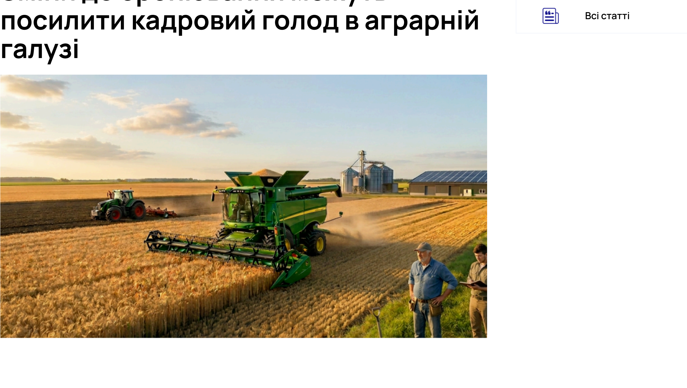
Через нові правила бронювання агросектор може зіткнутися з новою хвилею нестачі кадрів

Зміни до порядку бронювання військовозобов'язаних можуть поглибити дефіцит кадрів в аграрному секторі, який уже наближається до 30% від наявної потреби в працівниках. Втрата права на відстрочку для частини працівників-сумісників створює додаткові ризики для безперервної роботи агропідприємств, продовольчої безпеки країни та конкурентоспроможності України на світовому ринку аграрної продукції.