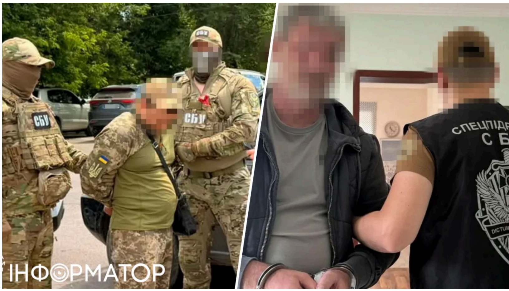
Одинадцять нових оборудок із призовом розкрито

Правоохоронці одночасно заблокували одинадцять корупційних схем ухилення від призову у восьми регіонах України та затримали організаторів. Раніше в межах аналогічних операцій силові структури вже прикривали схеми для ухилинтів , серед організаторів яких також були військові та медики. За участь у нових оборудках ділки брали від 3,5 до 38 тисяч доларів США - в обмін на підроблені документи або переправлення через кордон поза пунктами пропуску. Фігурантам справ загрожує до 10 років ув'язнення з конфіскацією майна.