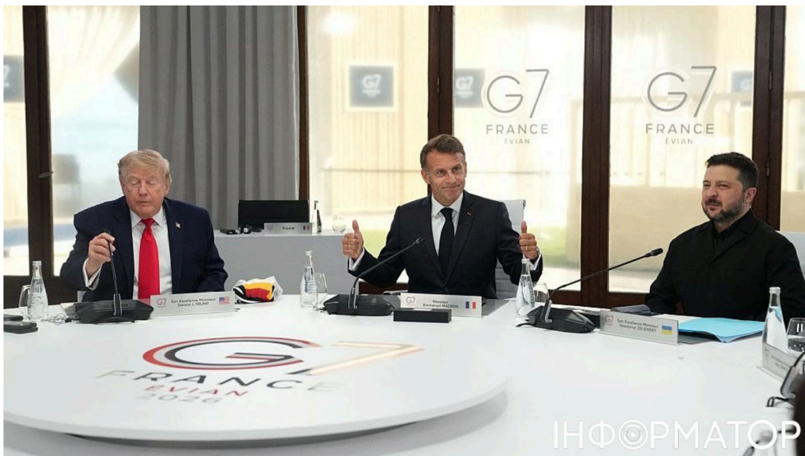
Трамп вже зустрівся з Зеленським та Макроном на G7.

Президент США Дональд Трамп публічно закликав Росію укласти мирну угоду, назвавши втрати обох сторін у війні "просто божевільям". Водночас він оголосив, що сьогодні проведе ще одну зустріч з президентом України Володимиром Зеленським на полях саміту G7 у французькому Евіані. Напередодні Зеленський зателефонував Трампу, і вони домовились детально поговорити на саміті G7.