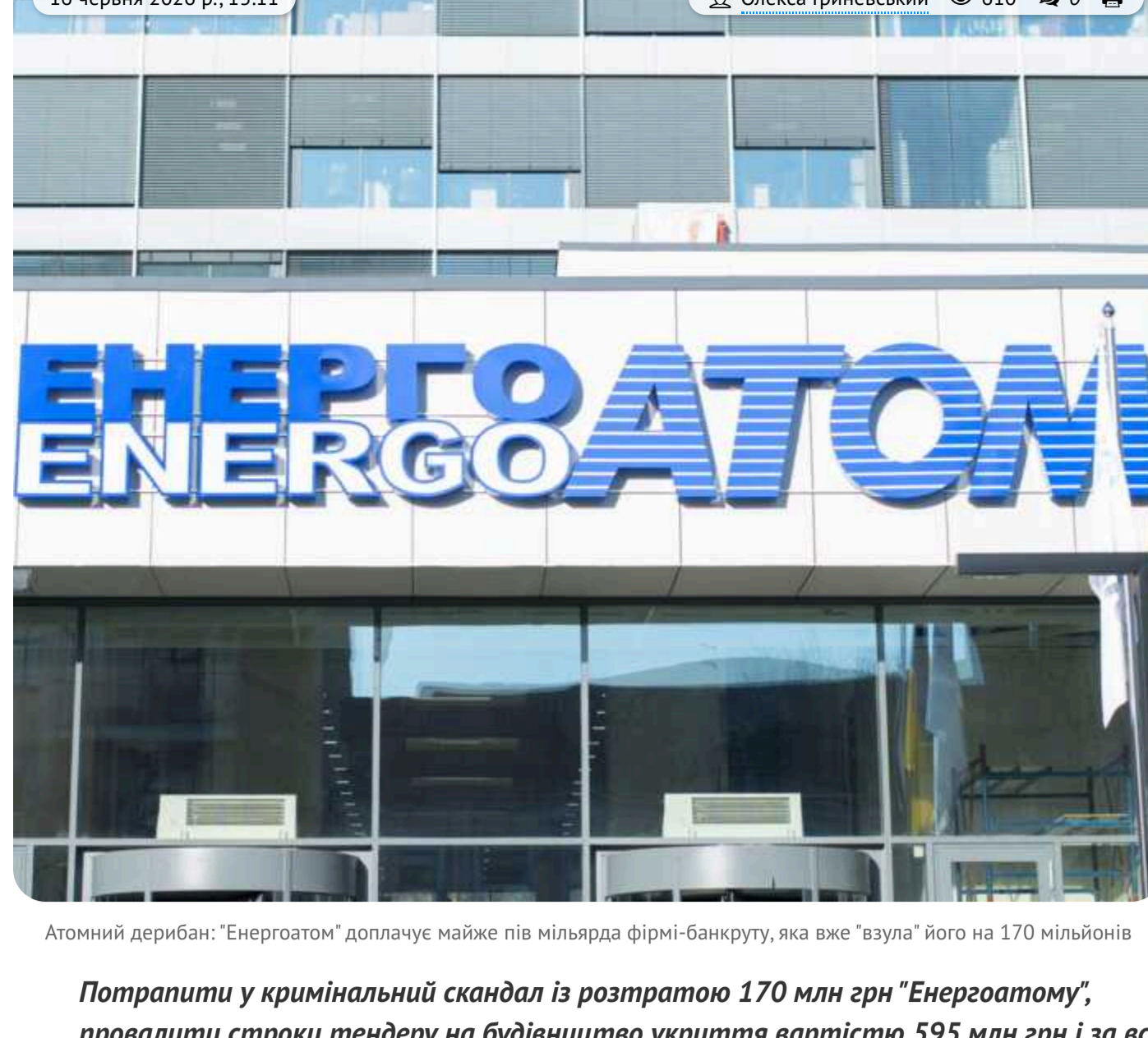
Атомний дерибан: "Енергоатом" доплачує майже пів мільярда фірмі-банкруту, яка вже "взула" його на 170 мільйонів

Потрапити у кримінальний скандал із розтратаю 170 млн грн "Енергоатому", провадити стріки тендеру на будівництво укрита вартістю 595 млн грн і за все це отримати... додаткових майже 500 мільйонів. Та до цього ще й бути банкрутом.