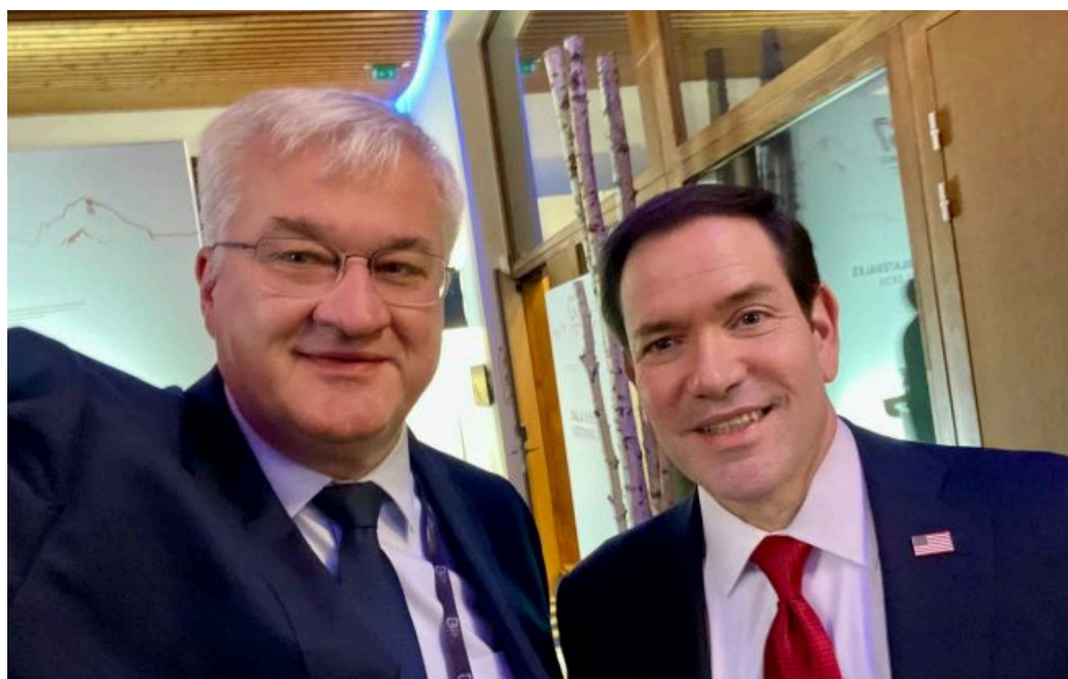
Фото: глава МЗС Андрій Сибіга з держсекретарем США Марко Рубіо на саміті G7 у Франції