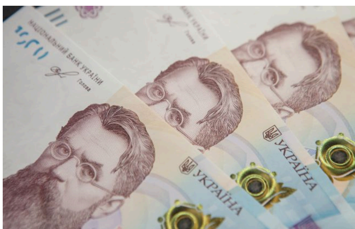
Фото: Грошова допомога в Україні