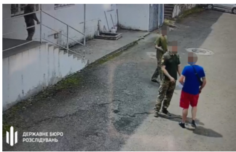
Фото: на Закарпатті ДБР розслідує обставини смерті чоловіка після перебування у ТЦК (dbr.gov.ua)

Тривають першочергові слідчі дії - співробітники ДБР встановлюють обставини, перевіряють дії службових осіб ТЦК, а також своєчасність і повноту надання медичної допомоги.