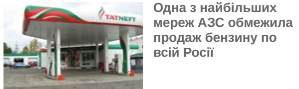
Одна з найбільших мереж АЗС обмежила продаж бензину по всій Росії