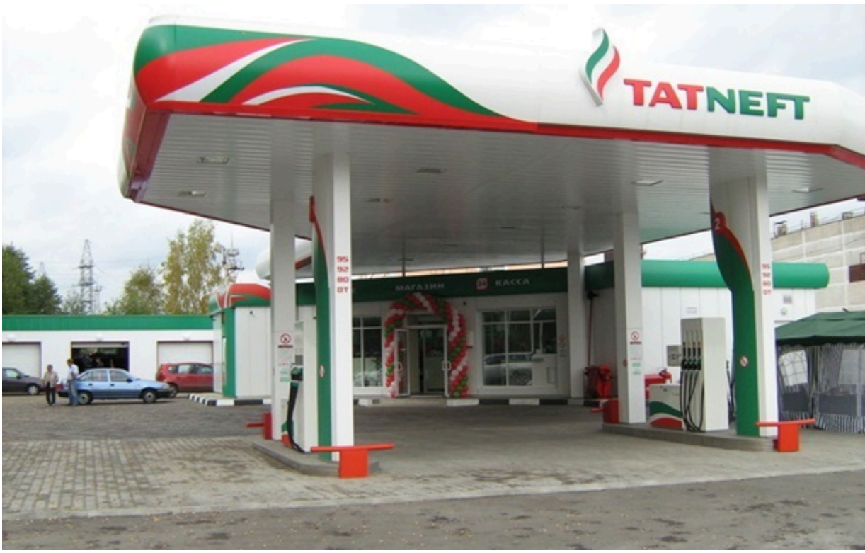
Татнефть запровадила обмеження на продаж пального на всіх своїх АЗС у Росії

Мережа АЗС Татнефть запровадила ліміти на продаж бензину та дизельного палива і приймає лише готівку.