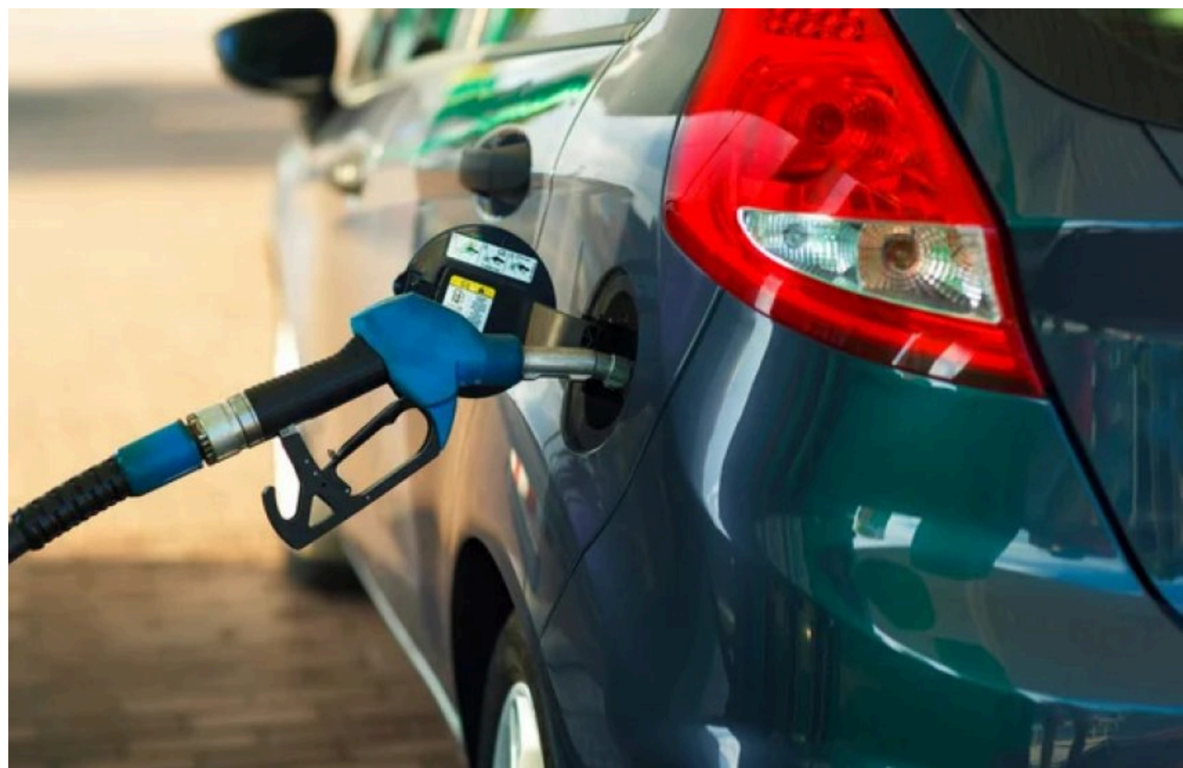
Ціни на пальне 16 червня 2026 року

Розповідаємо, скільки коштує літр бензину, дизелю та автогазу. Дані виданню Delo.ua надала Консалтингова група А-95 .