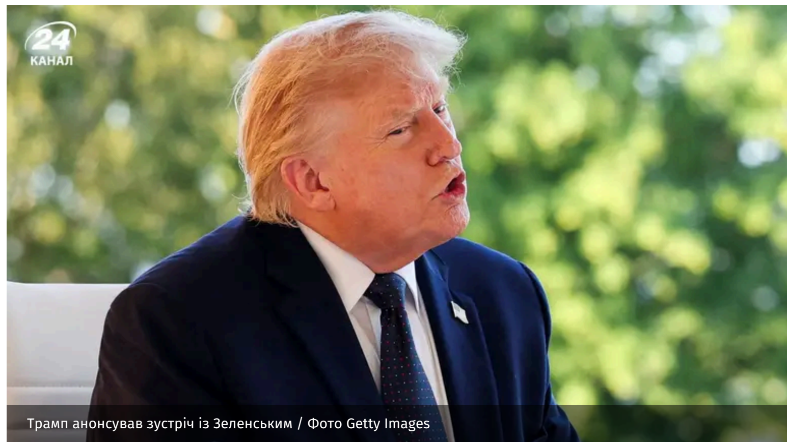
Трамп анонсував зустріч із Зеленським

Президент США Дональд Трамп заявив, що Росія має погодитися на укладення мирної угоди. Водночас він повідомив про заплановану зустріч із Володимиром Зеленським на полях саміту G7.