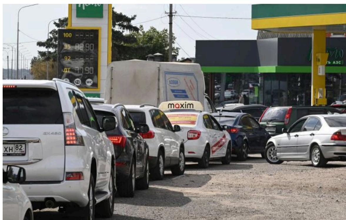
Фото: росіяни зіткнулися з лімітами на пальне (росЗМІ)