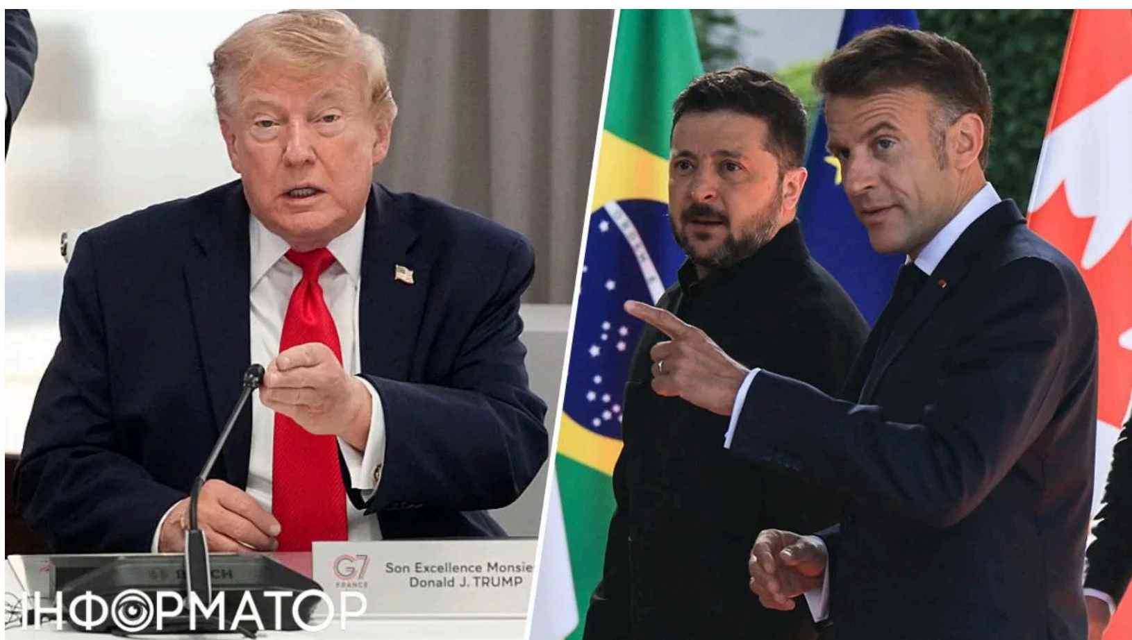
Трамп, Макрон і Зеленський на G7 в Евіані.

Президент США Дональд Трамп, президент України Володимир Зеленський і президент Франції Еммануель Макрон зібралися в Евіан-ле-Бені на саміті "Великої сімки" . Мирний план для України залишається одним із головних питань, навколо яких точаться суперечки між союзниками. Саміт G7 тривав з 15 по 17 червня - саме під час нього мають пройти ключові дискусії про підтримку Києва та врегулювання іранської кризи. Зеленський отримав запрошення від Макрона як гість саміту - не як повноправний член G7.