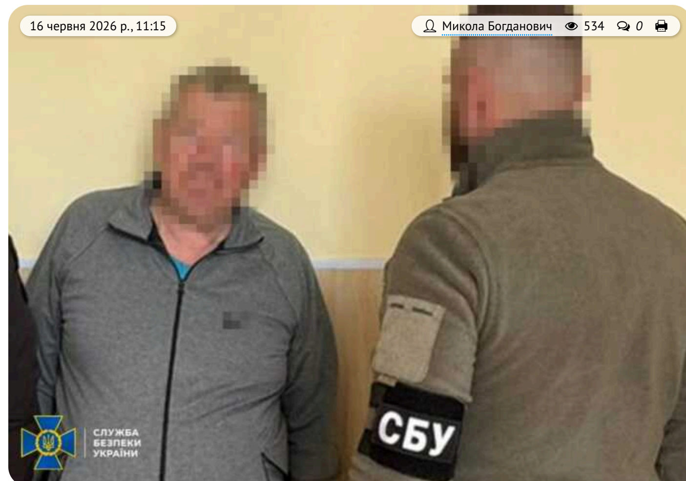
СБУ викрила агента РФ, який коригував удари ворога по позиціях Сил оборони на Донеччині

СБУ затримала агента РФ, який відстежував позиції Сил оборони та передавав координати ворогу. На Донеччині викрито його діяльність, вилучено телефон із розвідданими.