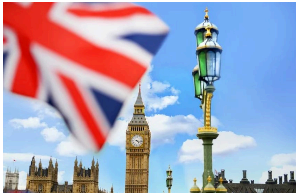
Велика Британія запроваджує нові санкції проти російського енергетичного сектору

Велика Британія оголосила про нові санкції проти Росії, зокрема "тіньового флоту", а також фінансових структур, які використовуються для обходу обмежень та озброєння російської армії. Вперше санкції торкнуться низки суден, які перевозять російський підсанкційний скраплений природний газ (СПГ).