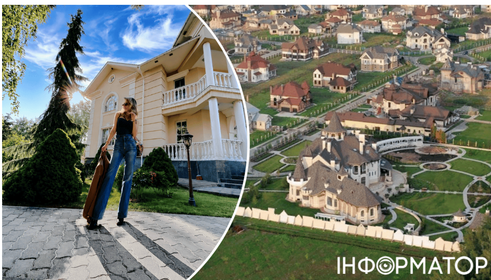
Лобода продала останній маєток у Росії

Українська співачка Світлана Лобода більше не має жодної нерухомості в Росії - її останній актив там нарешті знайшов нового господаря. Візд Лободи з Москви та підтримка України були лише першим кроком у її розриві з країною-агресором - тепер вона позбулась і матеріального зв'язку з нею. Трирічний процес продажу завершився у травні 2026 року, хоча деталі угоди стали відомі лише зараз.