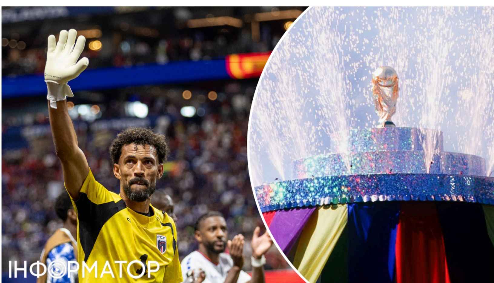
П'ятий день ЧС-2026 - чотири нічії поспіль.

П'ятий ігровий день чемпіонату світу-2026 увійде в історію Мундіалю як день суцільних сенсацій. Турнір не вщуає - і продовжує дивувати несподіваними результатами. Цього разу всі чотири матчі у групах G та H завершилися нічиєю: Іспанія не змогла обіграти дебютанта Мундіалю, Бельгія врятувалася від поразки, а Саудівська Аравія відібрала очки в Уругваю. Головною ж зіркою дня став 40-річний голкіпер Кабо-Верде, який за кілька годин здобув світову славу.