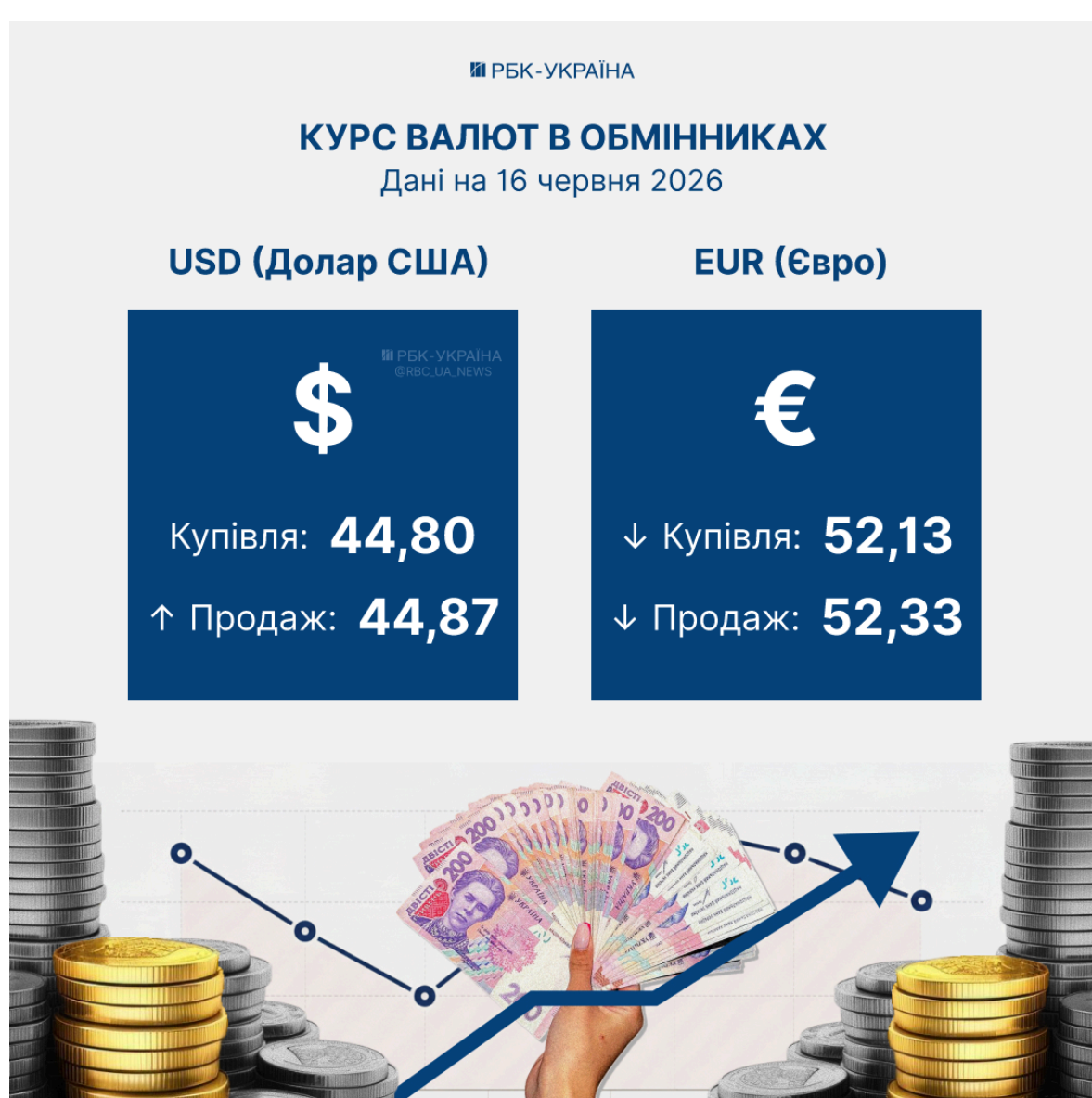
Фото: курс валют в обмінниках на 16 червня (Інфографіка РБК-Україна)

Євро знизився. Середній курс купівлі – 52,33 гривні (-2 коп.), курс продажу – 52,13 гривні (-2 коп.).