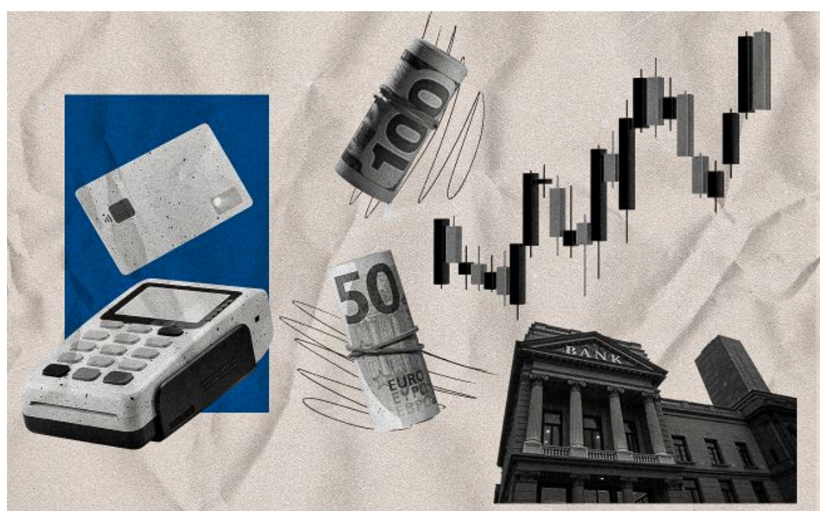
Фото: банки та обмінники оновили курси валют на 16 червня

Не чекай змін - готуйся до них! Фільтруй валютні коливання з РБК-Україна у Google