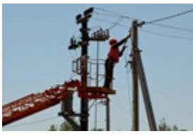
Укренерго повідомило, в яких регіонах відключення

У Стокгольмі відкрили Центр єдності українців