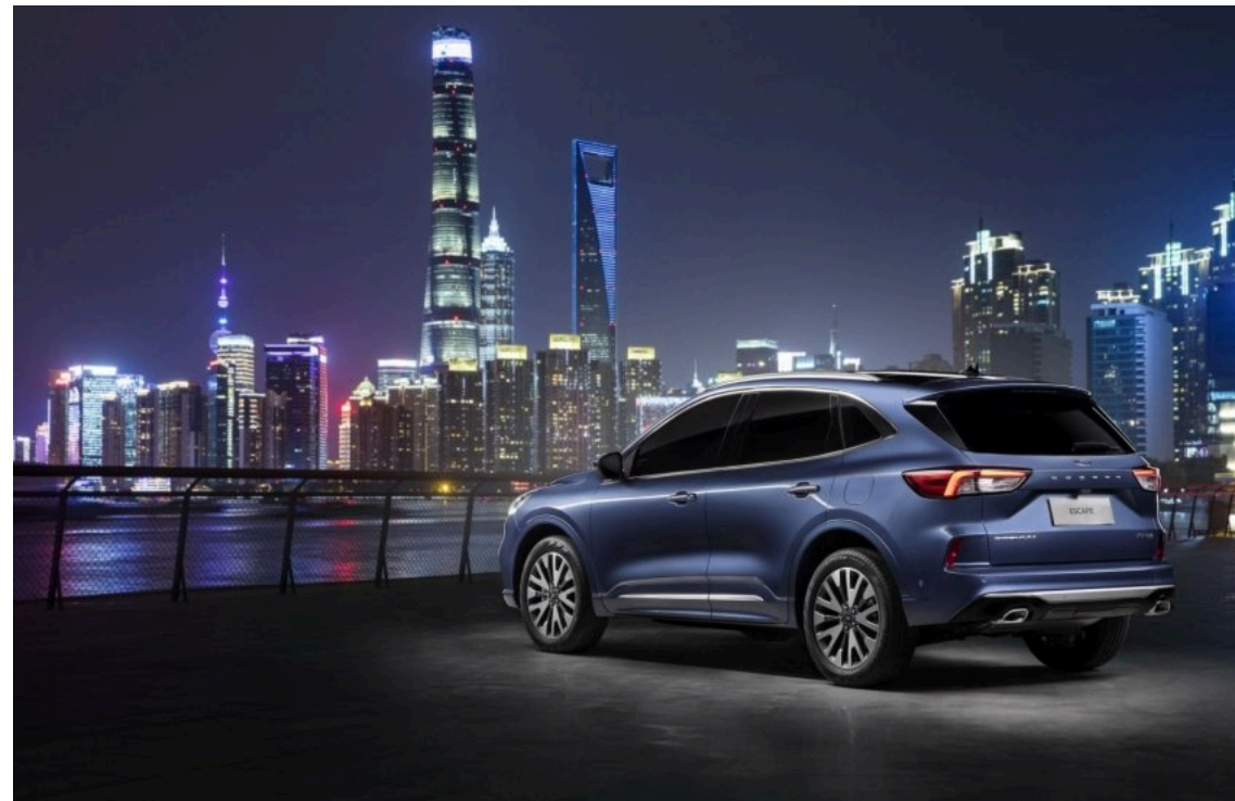
Ford Escape

У травні українці придбали 3,8 тис. вживаних легковиків, ввезених із США, що на 12% менше, ніж за аналогічний період 2025 року.