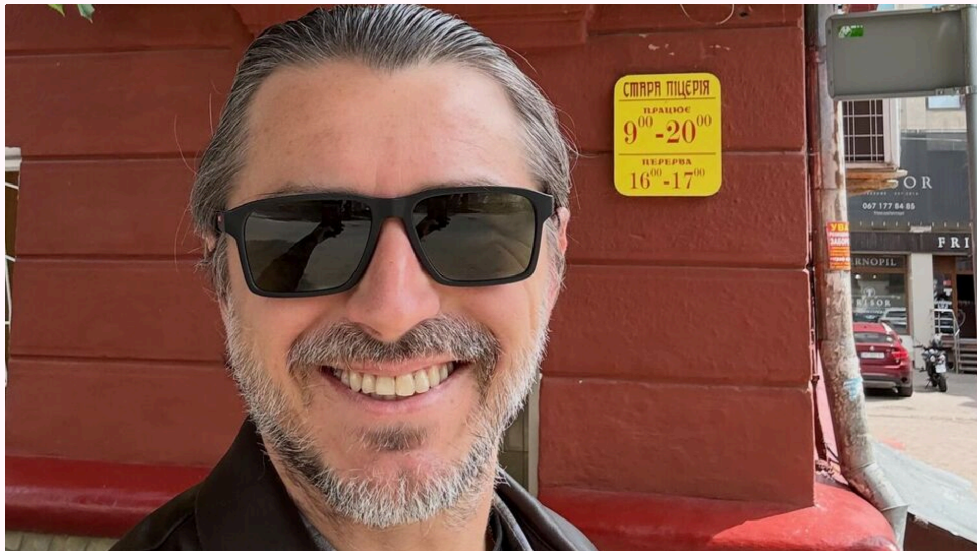
Притула: Я не маю права їх оголошувати

16 червня, 09.26 🗨️ Этот материал также можно прочитать на русском