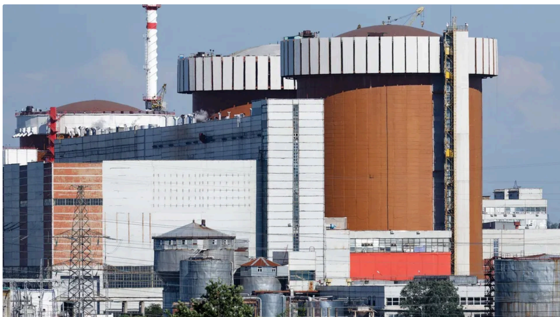
Британія профінансує постачання урану для українських АЕС на €210 млн

16 червня, 09.46 🗨️ Этот материал также можно прочитать на русском