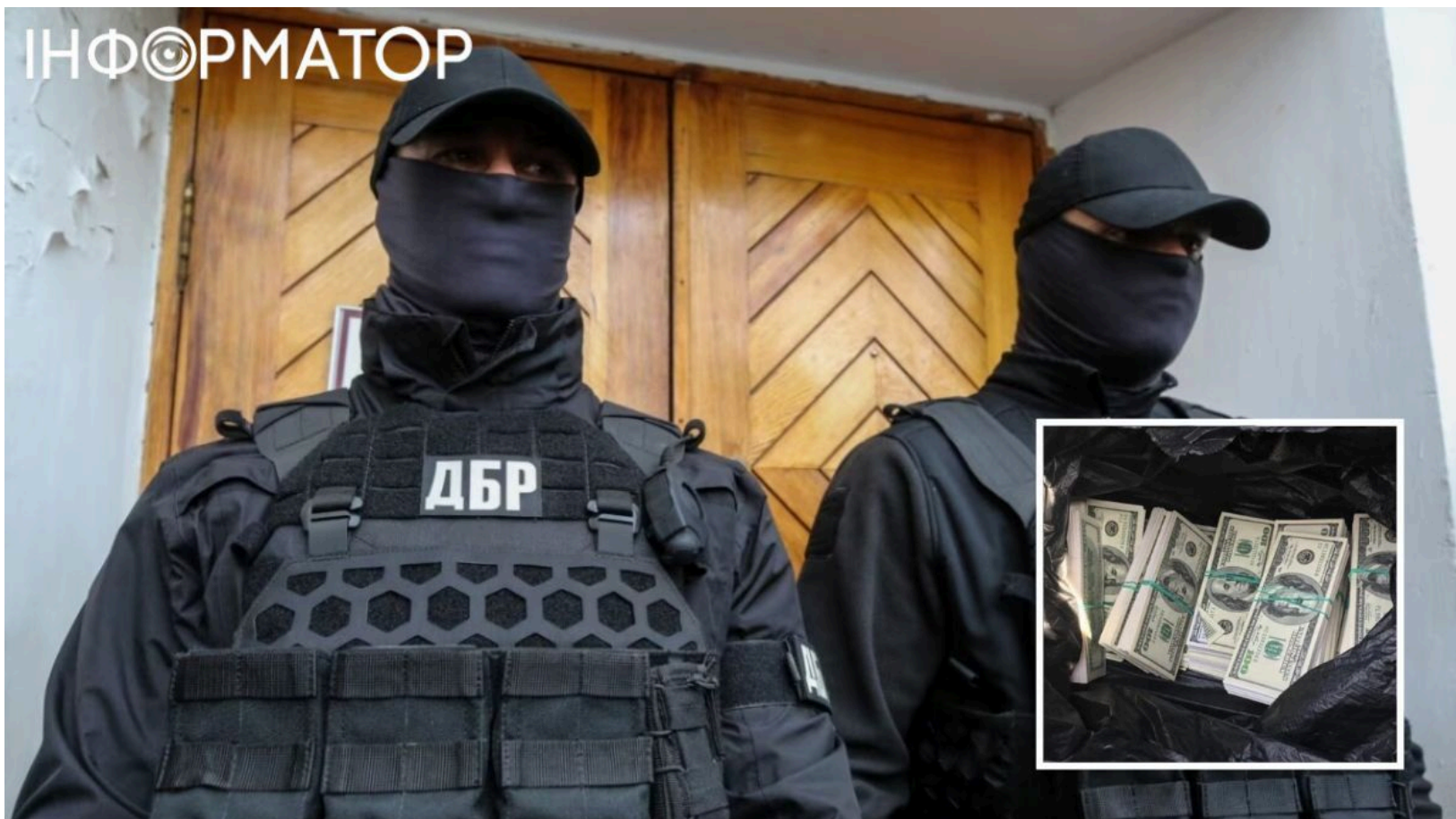
ДБР викрило збитки держави на 7,7 млрд

Слідчі ДБР задокументували масштабні зловживання з державними ресурсами, через які бюджет країни зазнав збитків на понад 7,7 мільярда гривень. Це результати роботи бюро за перші п'ять місяців 2026 року. Йдеться про протиправні дії посадовців, які мали б забезпечувати раціональне використання державних коштів, а натомість зловживали службовим становищем.