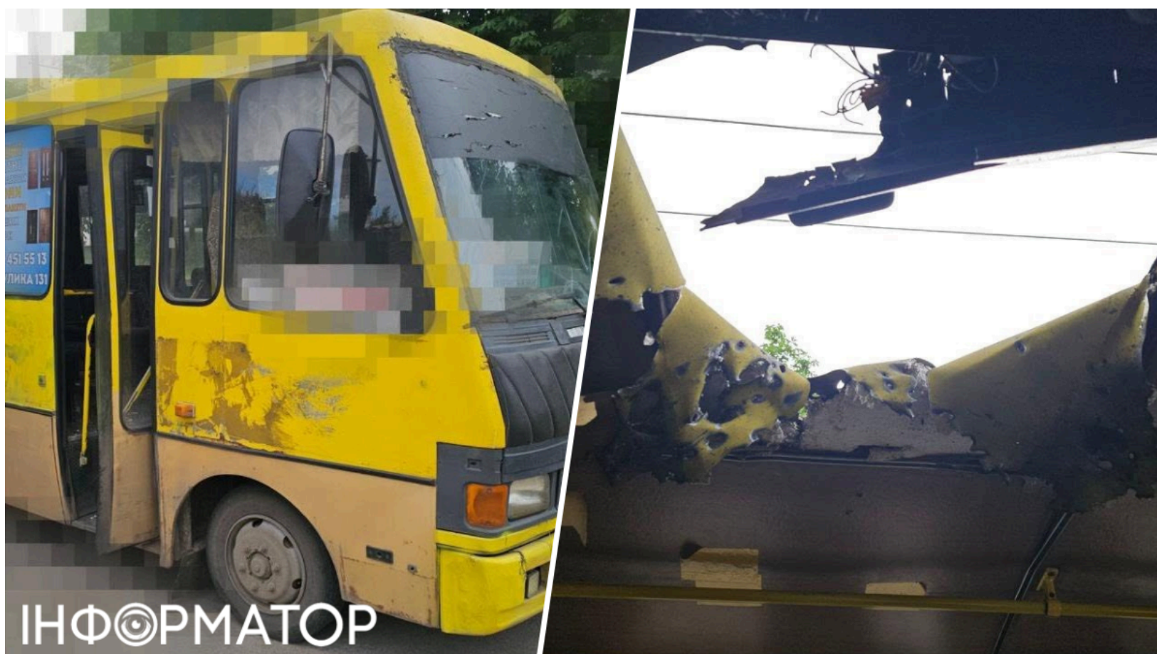
Дрон РФ вбив пасажирів маршрутки в Херсоні

Російські військові вранці 16 червня вдарили дроном по маршрутному автобусу у Корабельному районі Херсона - один чоловік загинув на місці, ще двоє людей потрапили до лікарні. Атака сталася в ранкову годину пік, коли мешканці їхали на роботу. Розпочато досудове розслідування за фактом воєнного злочину.