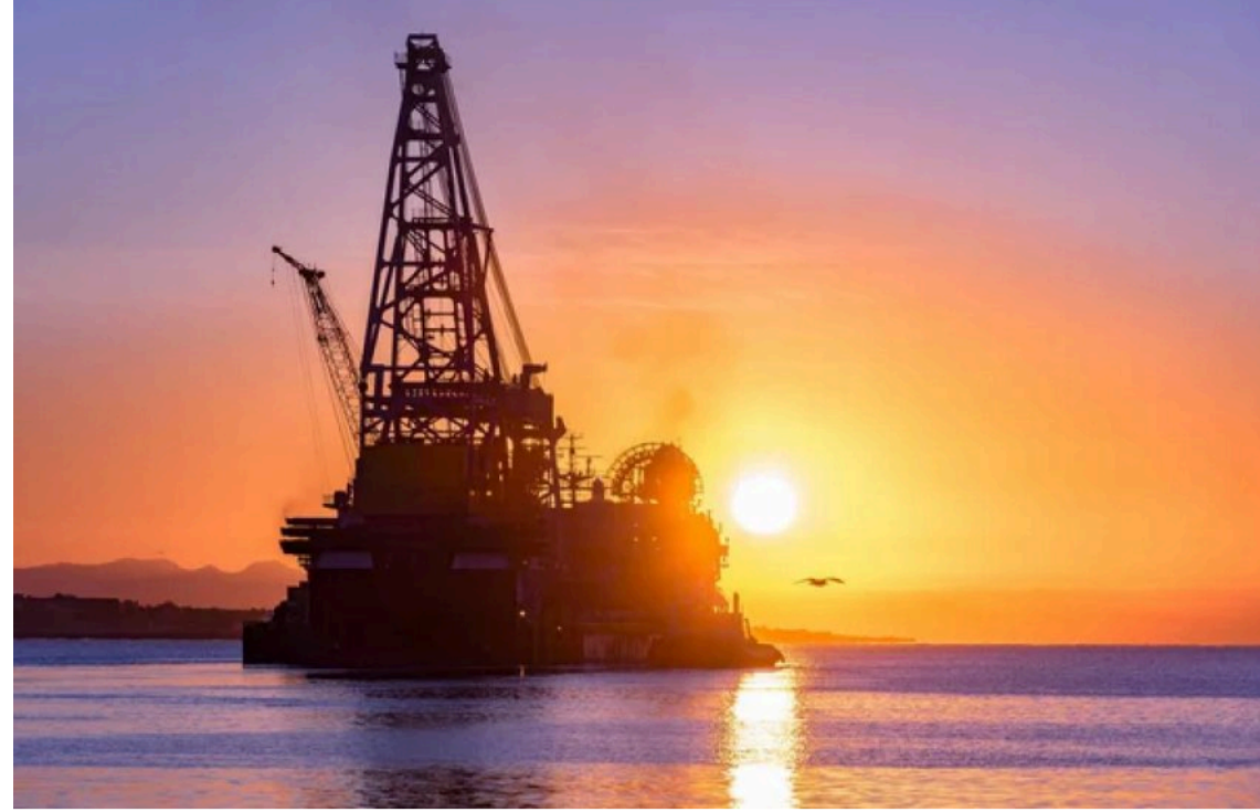
Ціна нафти на 16 червня

Станом на 16 червня 2026 року ціна нафти Brent становить $83,18 за барель, WTI – $80,38, а Urals – $72,55. Нафта продовжує дешевшати через очікування розблокування Ормузької протоки. Проте падіння цін стримується нестабільною кон'юнктурою ринку та відсутністю деталей щодо угоди про припинення війни з Іраном.