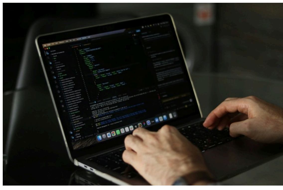
Майже третина українських IT-компаній завершила 2025 рік зі збитками

Попри те, що 68% українських IT-компаній залишаються прибутковими, понад 31% юридичних осіб у сфері інформаційних технологій завершили 2025 рік із фінансовими збитками.