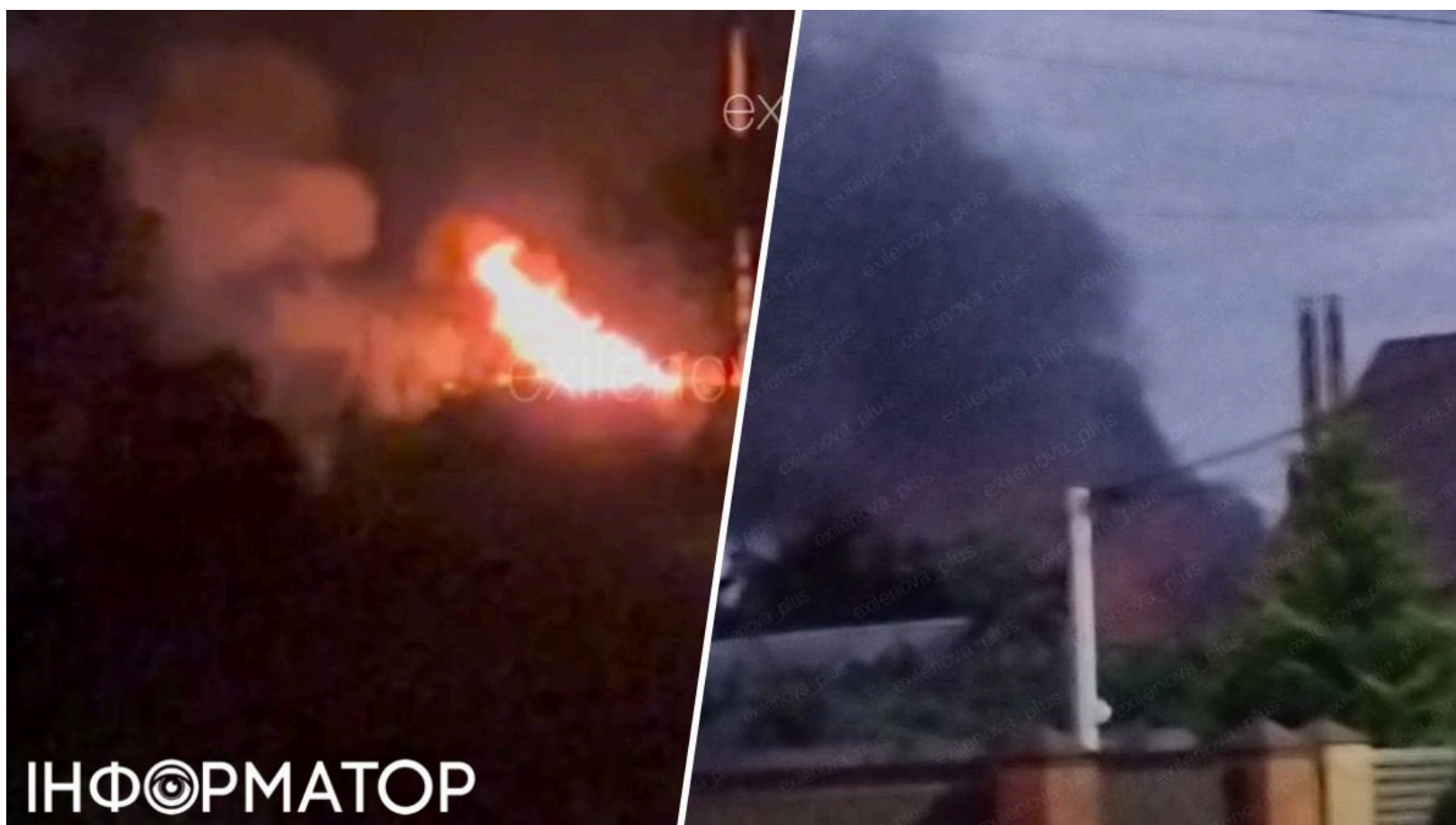
Нафтобаза у Краснодарі горить після атаки дронів

У станиці Полтавська Красноармійського району Краснодарського краю після атаки безпілотників загорілася нафтобаза. Вогонь гасять десятки рятувальників, рух на трасі поблизу перекрито. Російська сторона традиційно стверджує, що пожежа виникла нібито через падіння уламків збитого БПЛА.