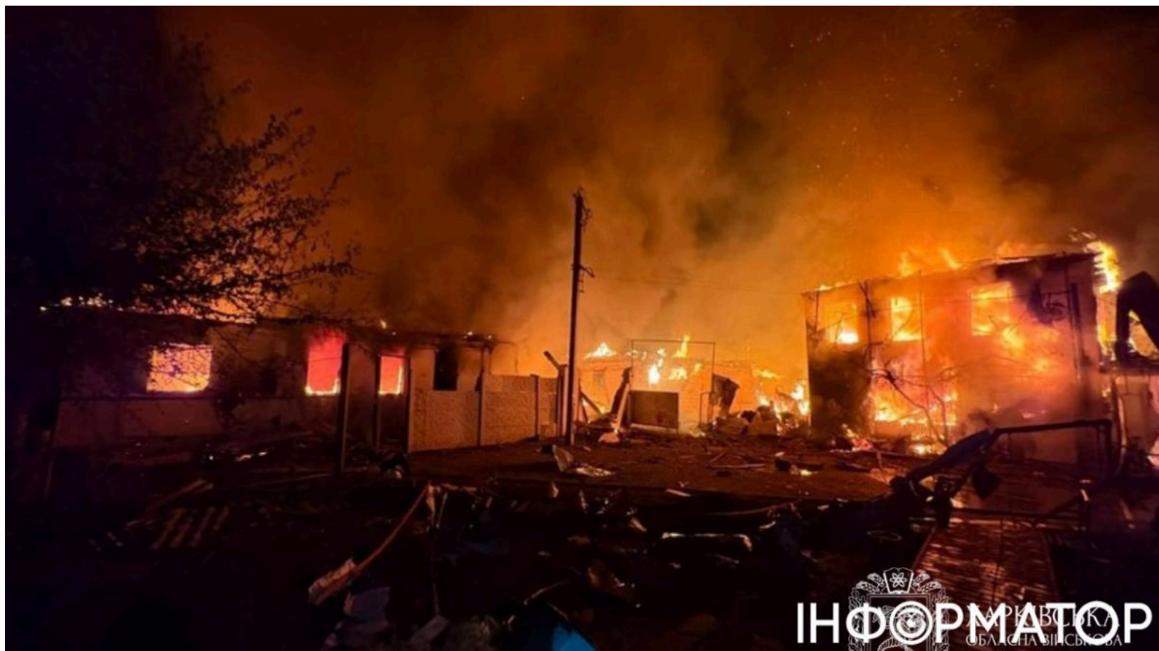
Ворожий дрон вдарив по Балаклії

Вночі російські безпілотники атакували Балаклію на Харківщині. Серед восьми постраждалих - двоє дітей: 4-річна дівчинка та 13-річний хлопчик. Удар спричинив масштабні пожежі у житловому секторі міста.