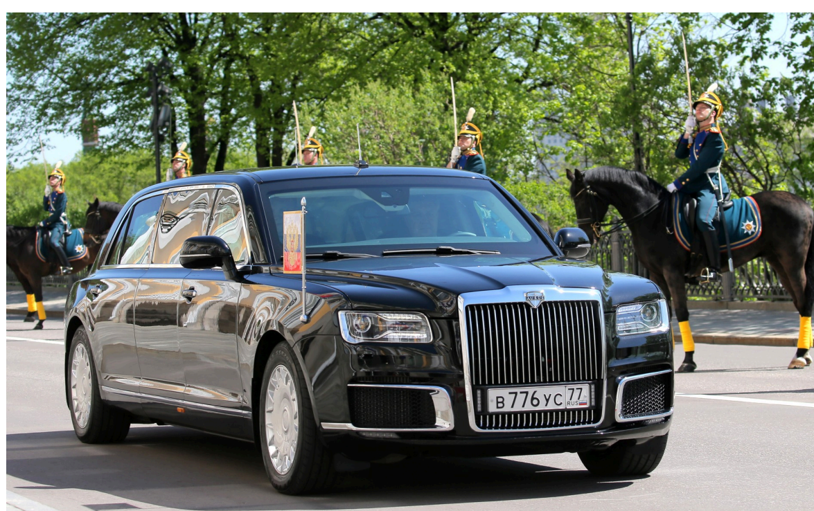
Фото: автомобіль марки Augus (kremlin.ru)

Новий бюджетніший варіант Augus 900, презентований на Петербурзькому економічному форумі, базується на китайській моделі Hongqi H9.