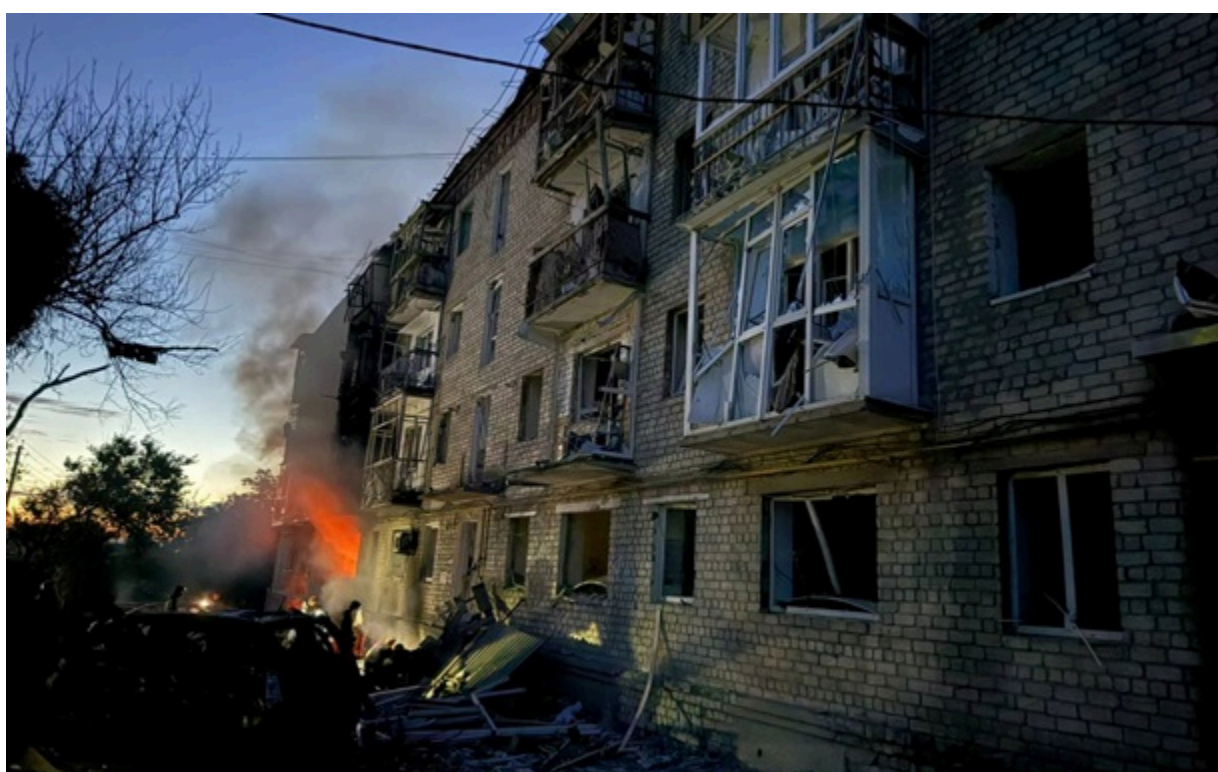
РФ продовжує тероризувати мирне населення Харківщини

Зафіксовано влучання у приватний сектор, поряд з багатоквартирними житловими будинками та в цивільне підприємство. Шестеро постраждалих.