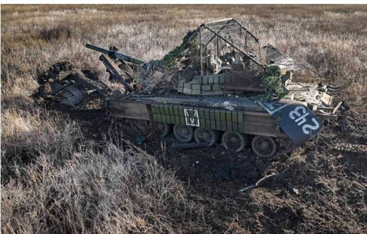
ЗСУ нищать ворожу техніку і живу силу окупантів

Українські збройні сили протягом минулої доби знищили понад 417 одиниць військової техніки та автоцистерн окупантів.