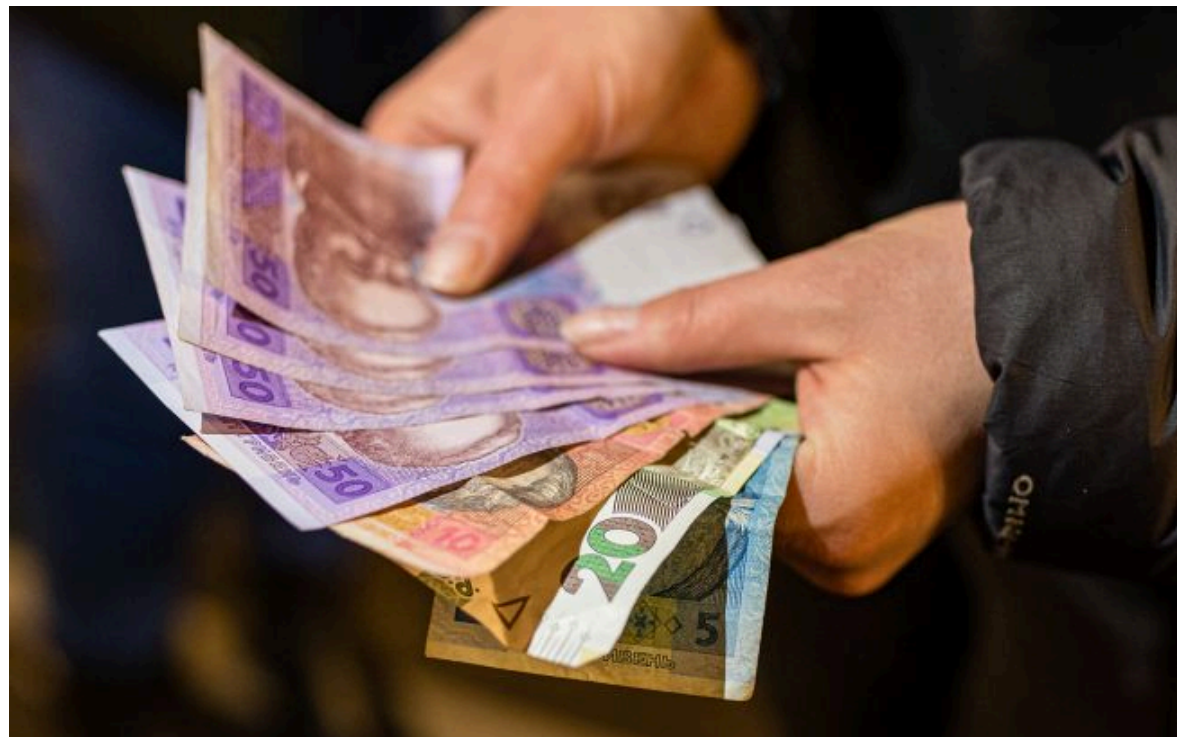
Фото: кошти можна витратити на комуналку, ліки та інші категорії