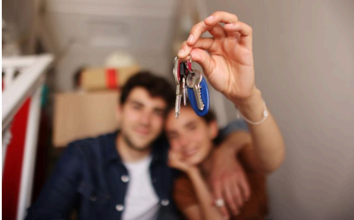
Фото: В Україні виріс попит на маленькі квартири (Getty Images)